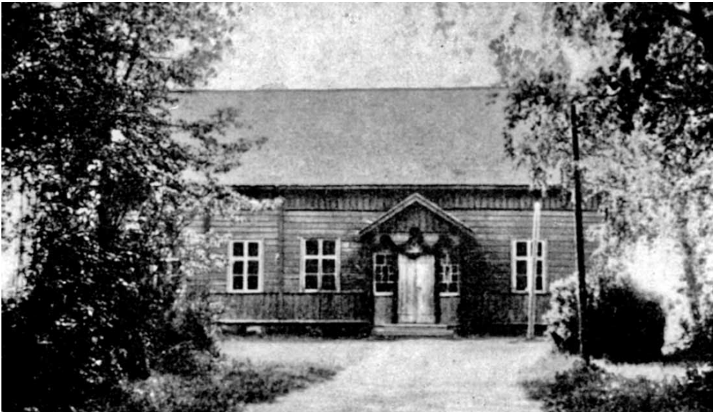
Raudun nuorisoseuran talo.

Eri seuroista ja niiden aktiivisimmista toimihenkilöistä on Entinen Raututeoksessa annettu niin yksityiskohtainen kuvaus kuin käytettävänä olleet lähteet ovat sallineet, joten tässä voimme tyytyä vain seuratoiminnan yleiseen esittelyyn.