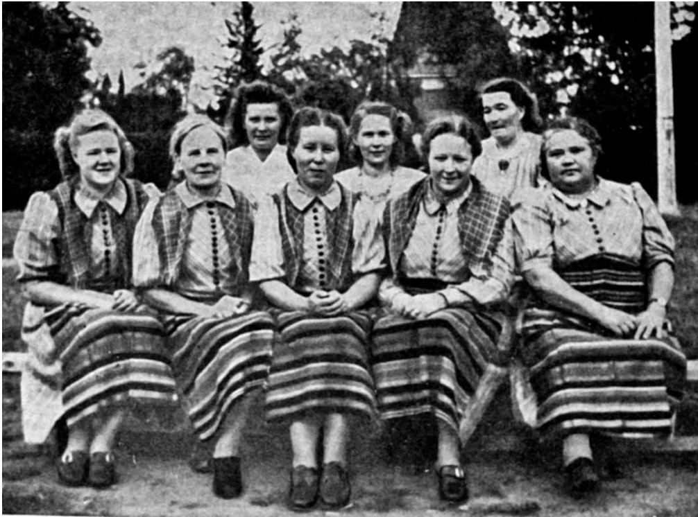
Marttojen johtokunta 50-vuotisjuhlassa Joroisissa 28.8.1949.