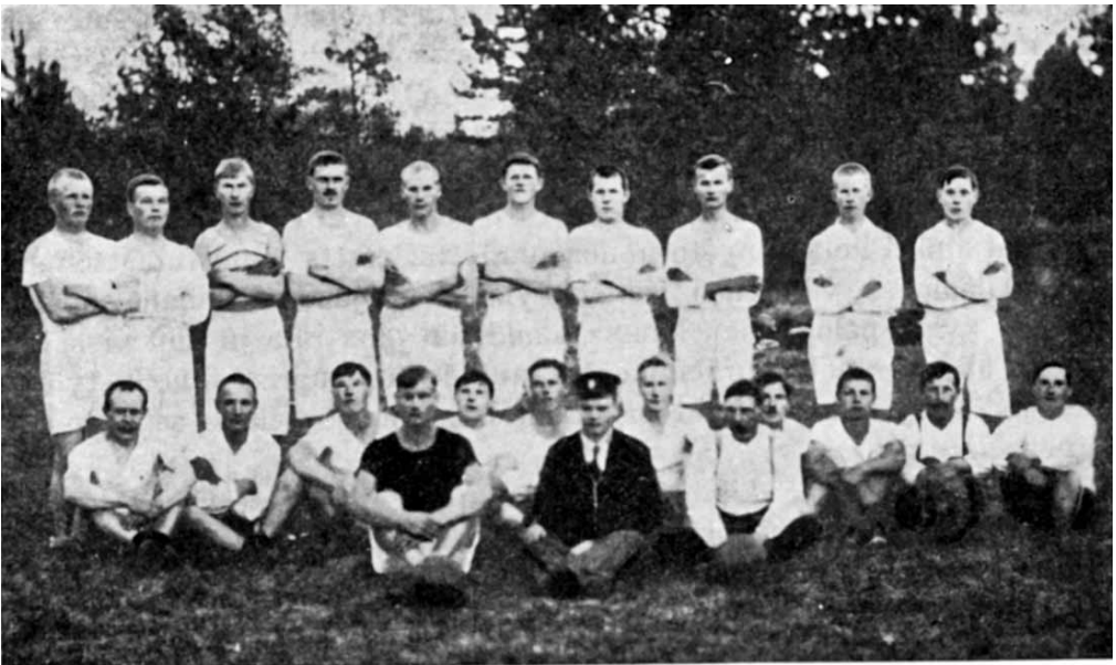
Orjansaaren ja Maanselän jalkapallojoukkueet.

Korleen ja Vepsan kirjastoseuroista on kerrottu toisessa yhteydessä.