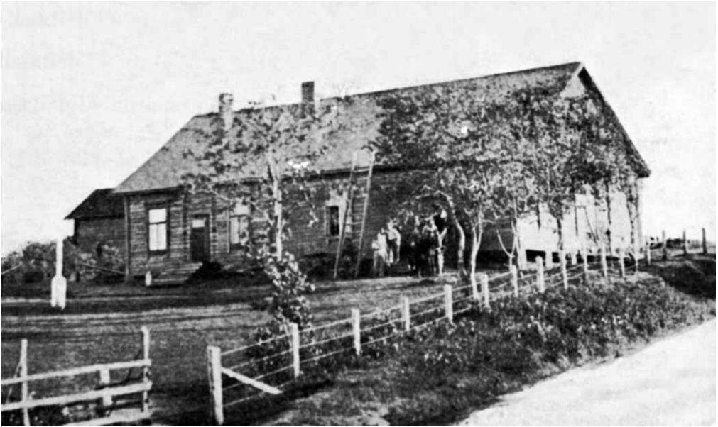
Maanselän Tarmon talo.

Mäkrän urheilunharrastajat perustivat voimistelu- ja urheiluseura Sovinon 1920. Keskuspaikkana oli Kipinän rakennuttama talo, kuten edellä on jo mainittu. Jalkapalloa, pesäpalloa, hiihtoa sekä muutakin urheilua harrastettiin ja illamat pidettiin omassa talossa.