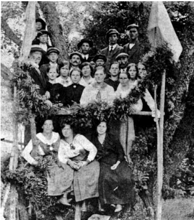
Suvenmäen nuorisoseuran laulukuoro kesäjuhlilla Miettilän hovin pihalla 1917.